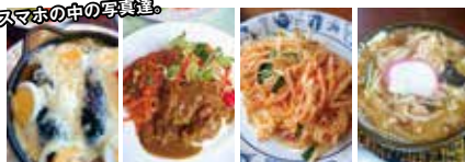
スマホの中の写真達