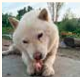
大好きな羊肉にガブリ!