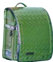
その名は、ベースキャンブ とっても頑丈そう!

事購入できました。あんな思いはしたくない。今年こそは/と思い胸にリベンジ/まずは、めっちゃおしゃれな資料とカラーサンプルを取り寄せ、いざ注文!!!Webサイトへ…と、もう遅かった…。目をつけていたランドセルはもう売り切れ。結局まだ予約可能な2種類から決めて、注文するまでの間、何度スマホ画面を更新し、在庫情報を確認したことか…。リアルタイムで商品がなくなっていくため、ハラハラ(´Д`);ドキドキ