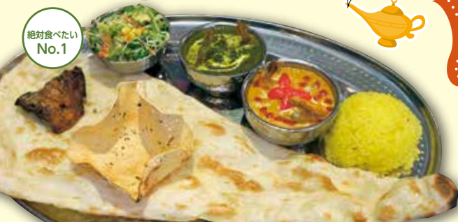
シバヤスペシャルセット ¥1,790(税込)