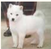
わが家に来てきた ビチビチの4ヶ月