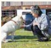
お手の数だけエサが貰える?