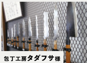
包丁工房タフサ様

「鑄起銅器」と呼ばれる、銅製品を鋳で叩いて形成する技法を使った製品を手がけています。「ブランド=自負」という言葉が印象深く、自分達の技術や在り方を自負することで、社員の目標や行動が一致しやすくなるのではと思いました。