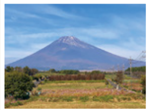
昨年の静岡旅行の写真です 快晴の富士山の写真が撮れました