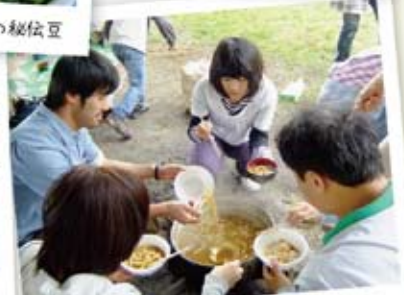
やっぱり締めはカレーうどんでしょう!!