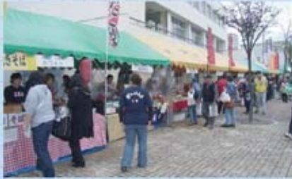
たくさんのお店で賑わうまつり会場