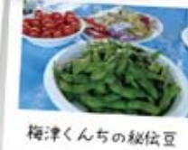
梅津くんちの秘伝豆