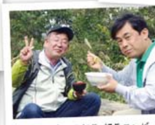
仲良く食べる部長・課長コンビ