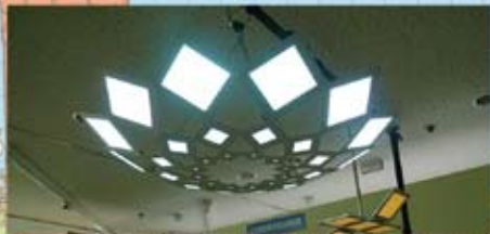
米沢から未来を照らす有機EL照明