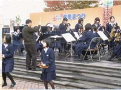
踊りも飛び出した米沢三中吹奏楽部のステージ

文化会館前では、米沢の友好、交流都市のブースが有りました。まずは復興支援もかねて石巻焼きそばを食しました。その後ポパロ内で有機EL等を見学。NECのブースではパソコンで3D映画を鑑賞。再び外に出て、セグウェイや米沢工業高校(米工)の電気自動車などを見てきました。再びお祭り広場に戻り、コーヒータム。最後は米沢食肉公社のロースハムステーキを食べ、お土産に東海市のお酒「平洲さん」と海老せんべいを購入し、満足して帰宅しました。(金子)