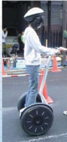
女の子もチャレンジ! 人気のセグウェイ!