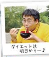
ダイエットは明日から~♪