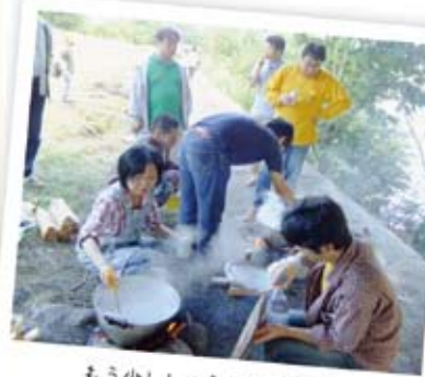
もう少ししょう油を入れる?

社員のご家族の方々に多数参加していただいたので、大所帯で開催することが出来、みんなで食べる芋煮はとても美味しく、あっという間になりました。終盤にちょっと天候が怪しくなってきたので小雨がぱらついたりしましたが、飲んで、食べて、運動して、今年の秋も満喫できました。また来年、開催できることを楽しみにしています。