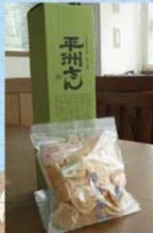
お土産は東海市のお酒とせんべい