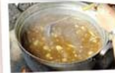
いよいよカレー投入!