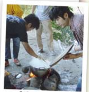
愛情たっぷり入れて煮込んであるわ◎