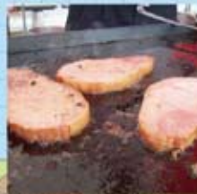
美味だったロースハムステーキ