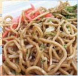
案外普通だった石巻焼きそば