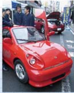
真っ赤な色が目立ってた米工の電気自動車