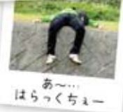
あ〜...はらっくちゅー