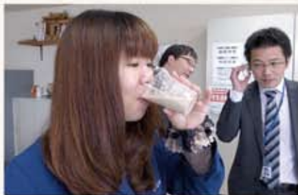
※被験者はどちらを飲んでいいのか分かりません。